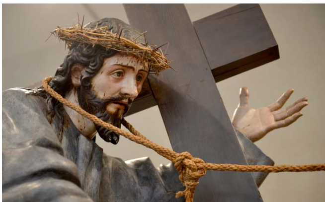
Kreuztragender Jesus – polychrome Holzskulptur, Bestandteil einer Passionsfigurengruppe aus dem 17. Jh., ausgestellt im Colegio de San Gregorio in Valladolid

Im spanischen Valladolid wird ein schöner Brauch aus der Zeit Teresas wachgehalten: Bei der Karfreitagsprozession trägt oder fährt man lebensgroße Figurengruppen, sogenannte pasos, durch die Stadt. Die Gläubigen sollen mit diesen Nachbildungen des Kreuzweges Jesu emotional berührt werden und sich auf diese Weise in das einstige Geschehen einfühlen. In Anlehnung an diese alte Tradition und auf ausdrückliche Empfehlung Teresas sei wieder eine geistliche Übung genannt - diesmal, um mit den Herausforderungen der zweiten Wohnung der inneren Burg fertig zu werden.