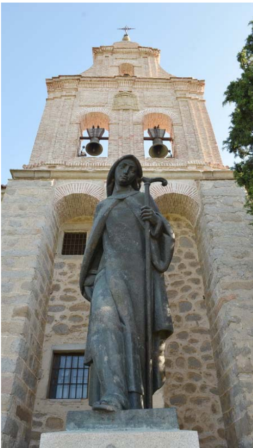
Hl. Teresa von Ávila – moderne Bronzefigur vor dem Kloster der Menschwerdung in Ávila

Der wichtigste Unterschied zwischen der ersten und zweiten Wohnung besteht für Teresa in der Empfindsamkeit der Seele. In der ersten Wohnung sind wir noch taub und hören das Rufen Gottes gar nicht. Deshalb orientieren wir uns mehr am Zeitgeist und können daher im eigenen Tun kaum Anstößiges entdecken. Erst durch die schmerzhafteste Selbsterkenntnis verliert die Seele allmählich ihre Abstumpfung; sie wird aufgeweckt und beginnt zu hören. Teresa weist ganz richtig darauf hin, dass uns Gott die ganze Zeit über ruft, damit wir zu ihm finden. Es ist allein eine Frage der Wahrnehmung.