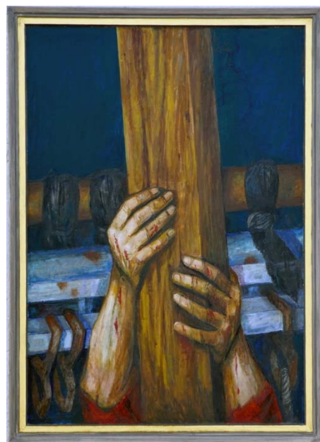
Bild aus dem Kreuzwegzyklus von Sieger Köder, Stephanuskirche in Wasseralfingen

Rissig ist das Holz. Rissig wie der Freundesbruch. Wie das viele Vertrocknete in mir. Aber auch wie neue Lebensnischen. Hart ist das Holz. Hart wie der einstige Urteilsspruch. Wie das Erstarrete in mir. Aber auch wie neuer Lebenshalt. Nass ist das Holz. Nass wie der blutende Kreuzesstamm. Wie der weinende Seelengrund in mir. Aber auch wie neuer Lebenssaft. Kalt ist das Holz. Kalt wie jene Mörderthat. Wie das Abgestorbene in mir. Aber auch wie neue Lebensfrische. Nah ist das Holz. Nah wie das unrechte Leid. Wie die eigene Ohnmacht in mir. Aber auch wie neue Lebenskraft.