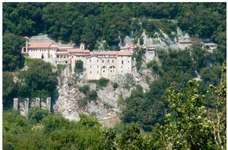
Blick auf Greccio in den Sabiner Bergen. Franziskus liebte diesen einst stillen Ort; heute bevölkern ihn viele Touristen.

Davon zeugt auch das große Wandbild in Ellwangen. Es erinnert an eine wahre Begebenheit im italienischen Greccio. Franziskus überlegte, wie er das einfache Volk mit der unaussprechlichen Freude von Weihnachten in Berührung bringen könnte? Und er kam auf eine geniale Idee: Er verlagerte die Weihnachtsmesse in eine Höhle außerhalb des Dorfes und stellte dabei auch die biblische Weihnachtsgeschichte nach – nicht mit leblosen Figuren, wie wir es kennen, sondern mit richtigen Menschen. Sogar mit echten Tieren. Alle gängigen Krippendarstellungen gehen auf dieses franziskanische "Schauspiel" zurück.