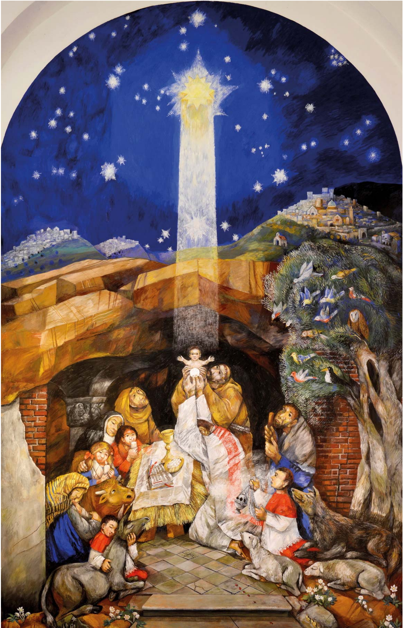
Wandbild in der Franziskusapelle